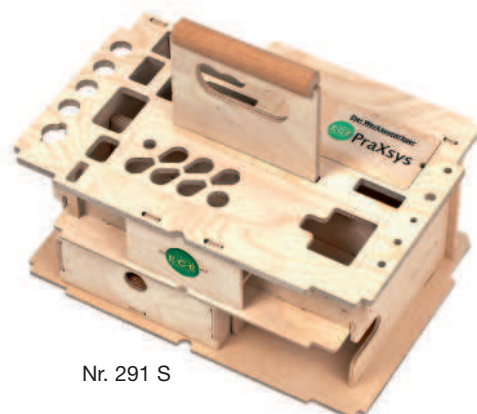
Nr. 291 S