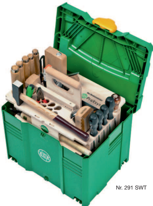
Nr. 291 SWT