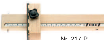
Nr. 217 P