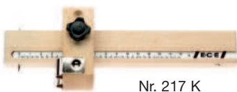
Nr. 217 K