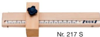
Nr. 217 S